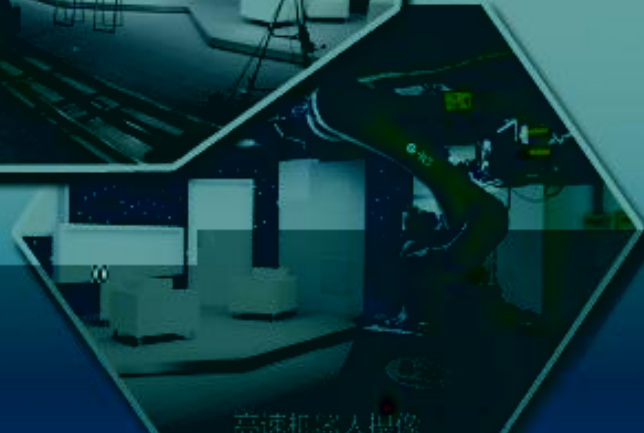
高速机器人操作室